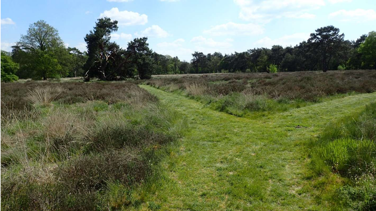
Figuur 4. Heide De Dannenkamp met Molinia en Calluna.

In het bos en de bosranden werd een groot aantal soorten geklopt. Hier zijn liefst 13 soorten boktorren gevonden. Vermeldenswaard zijn de niet zo algemene soorten als de naald-kortschildboktor ( Molorchus minor ) en de kleine populierenboktor ( Saperda populnea ). Van de bladkevers, de haantjes, zijn in totaal 25 soorten gevonden. Opvallende soorten zijn hierbij de minder algemene Gonioctena quinquepunctata , waarvan de hoofdverspreiding in de noordelijke provincies ligt. Ook het bruinrode meidoornhaantje Lochmaea crataegi wordt niet zo vaak aangetroffen.