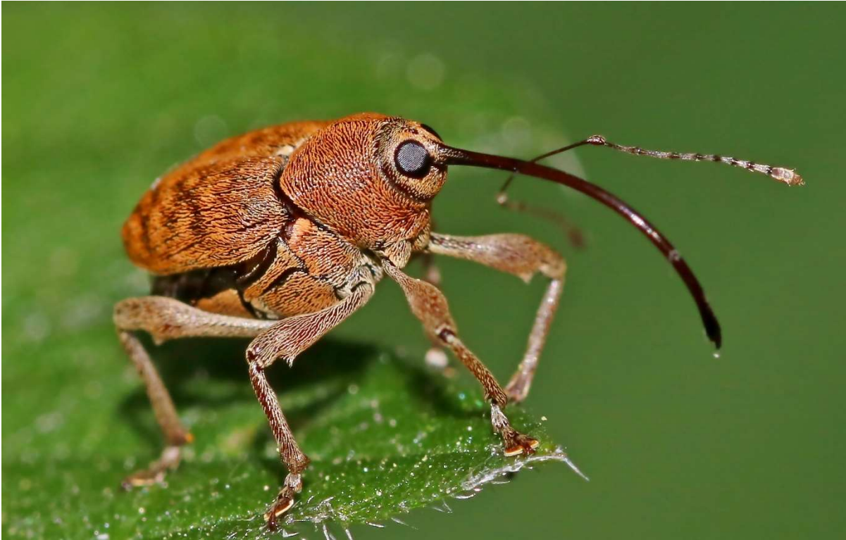
Figuur 5. Curculio glandium.