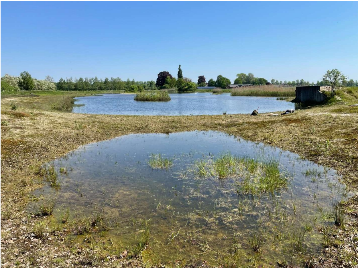
Figuur 1. De grote plas aan de overzijde van de Haarboersweg. Op de voorgrond de kleinere poel en rechts de oeverwaluwenwand met het vleermuizenverblijf

In en rond de grote plas en de kleinere watertjes aan de overkant van Haarboersweg (Figuur 1) is uitgebreid gezocht naar waterkever- en oeverkevers. De extreem kleine oeverkever Sphaerius acaroides , het oeverkogeltje, werd aangetroffen in een drijfteil met wateraardbei, waterdrieblad en riet. Nieuw voor de provincie Overijssel is de kleine waterroofkever Hygrotus nigrolineatus . Bijzonder is dat beide kleine waterroofkeversoorten van het genus Bidessus , B. unistriatus en de zeldzamere B. grossepunctatus zijn gevonden en ook de zeer kleine Hydroporus scalesianus . Vermeldenswaard is ook Ilybius montanus , een minder algemene soort van de hogere zandgronden, waarvan een mannetje is gevonden in de leemkuil op De Dannenkamp. Van de Hydrophilidae, de spinnende waterkevers, was het grote aantal exemplaren van het genus Berosus opvallend. Meestal treffen we van dit genus veel minder exemplaren aan. Verder waren zowel de kleine ( Hydrochara caraboides ) als de grote spinnende watertor ( Hydrophilus piceus ) aanwezig. Op de oeverplanten werden drie soorten riethaantjes gevonden: Donacia clavipes (op riet), D. semicuprea (op liesgras) en D. thalassina (op mattenbies). Op de oevers is de oeverpriemkever Bembidion litorale , vermeldenswaard. Deze niet algemene soort komt vooral voor op kale, zandige oevers.