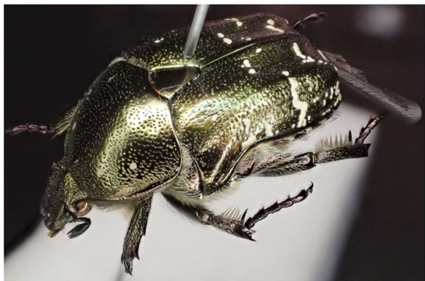
Figuur 3. Larve van de gedeukte gouden tor ( Protaetia metallica ) en het volwassen uitgekweekte dier (kweek: 13 mei 2023 – 10 april 2024)