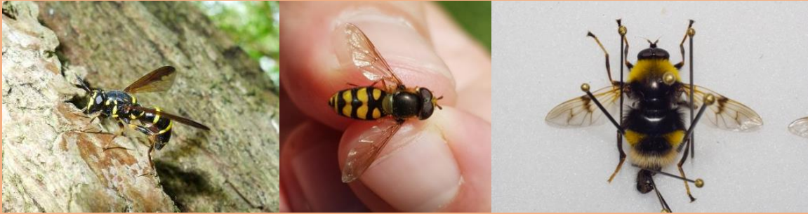
(van links naar rechts Sphiximorpha subsessilis , Eupeodes goeldlini , Pocota personata