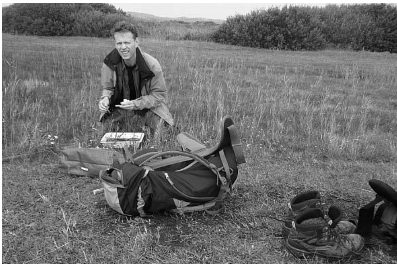
De eerste auteur aan het werk op Vlieland.

De 20 e weekendexcursie van de Sektie Everts vond in 2011 plaats op Vlieland. We overnachtten in de groepsaccommodatie Twest Endt in het meest westelijke deel van Vlieland dorp. In verband met de voor de meesten lange reistijd werd de duur van het weekend verlengd tot en met maandag. Het weer was goed en redelijk zonnig, met een enkele bui op zondag; de maandag was erg winderig.