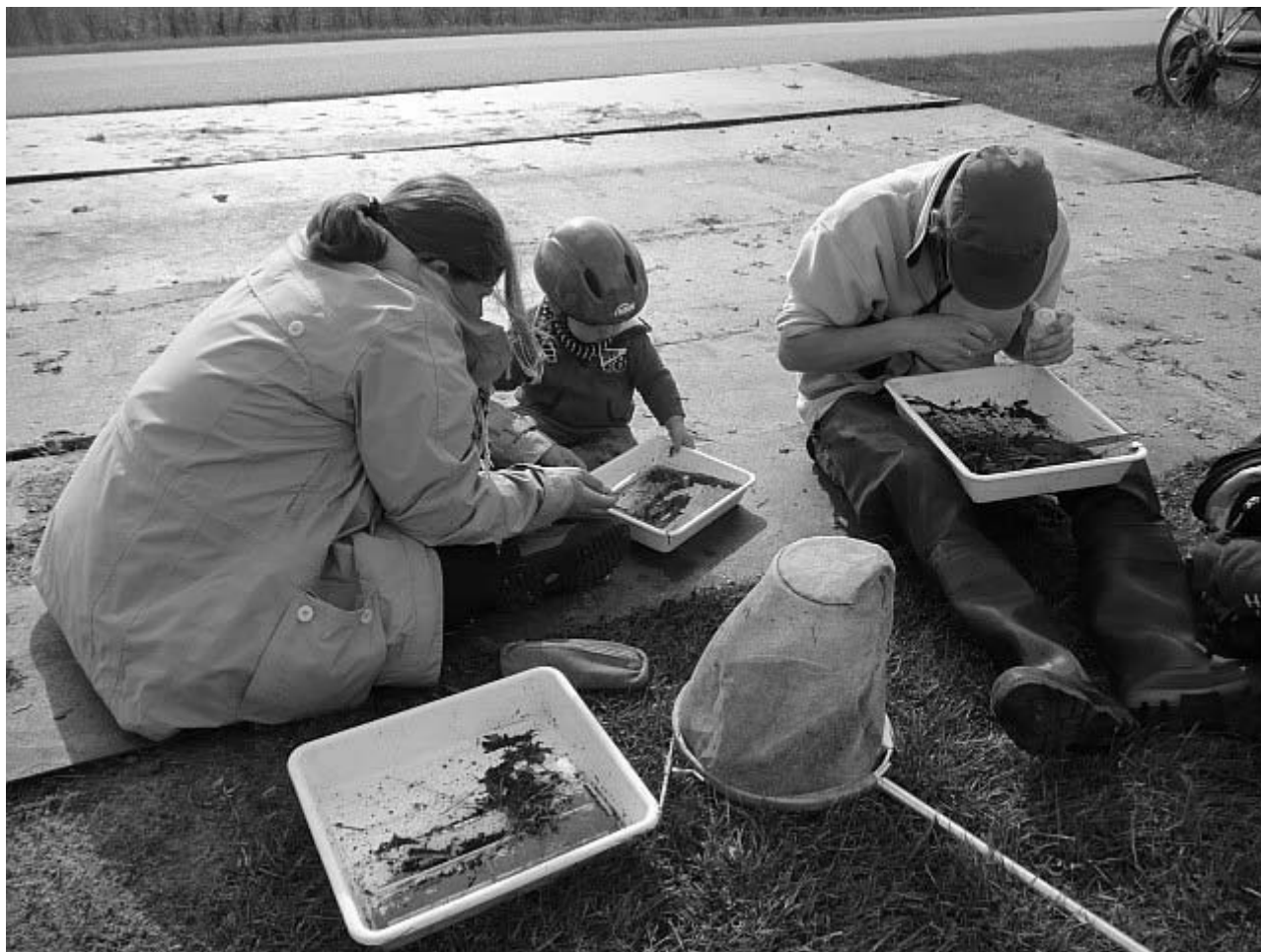
Ontluikend coleopterologisch talent op Vlieland

eerder uit Friesland bekende kortschildkever Philhygra arctica . De kortschild Scopaeus laevigatus en het haantje Sermylassa halensis , resp. nieuw voor Friesland en een wedervondst, werden gevonden in de natte duinvalleien van de Meeuwenvallei en de Kroonspolders. Ook de loopkever Amara convexiuscula was al lang niet meer gemeld uit Friesland.