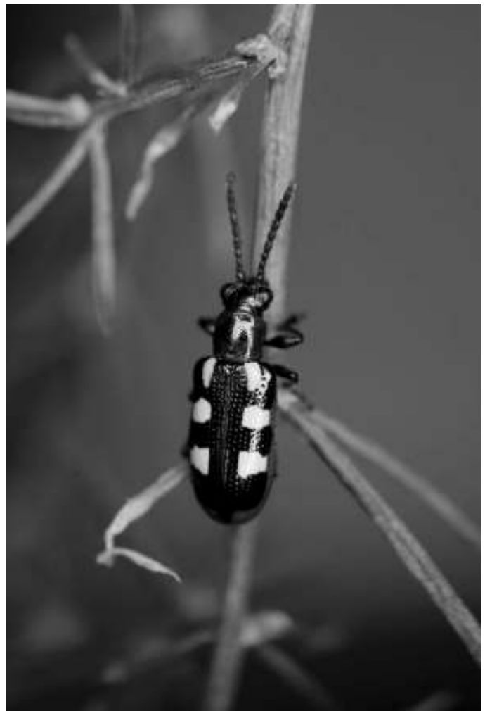
Het aspergehaantje Crioceris asparagi

Schriftelijke biedingen kunnen worden ingebracht bij Oscar Vorst, vorst*xs4all.nl