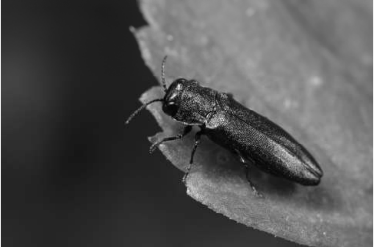
De prachtkever Agrilus cyanescens

Neem dus je eigen (on)gedetermineerde prachtkevers mee! Een drukproef van de te verschijnen tabel zal wel kunnen worden uitgedeeld.